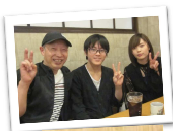
工場長と若手社員達