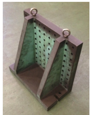
作られた鋳物のイケール② (実際に当社で現在使用しています)

単品物の鋳物製品は高いという概念を払しょくする為に、クサマ工業では日々工夫をしながら製造に取り組んでおります。今まで敬遠しがちだった企業様も、ぜひ一度「鋳物製品」をお試ししてみたいかがでしょうか？